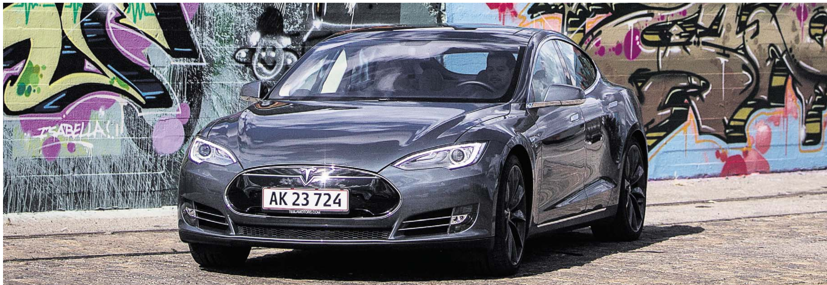
ELSPAND. Med den teknologiske udvikling og gældende afgifter vil der i 2030 ifølge Klimarådet køre ca. 260.000 elbiler rundt på de danske veje. Men den samlede bilpark vil i 2030 bestå af 3 mio. biler, så der er behov for afgiftslettelser.